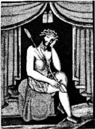
Христос у темниці. XIX ст. Полотно, олія. 74x55 см.