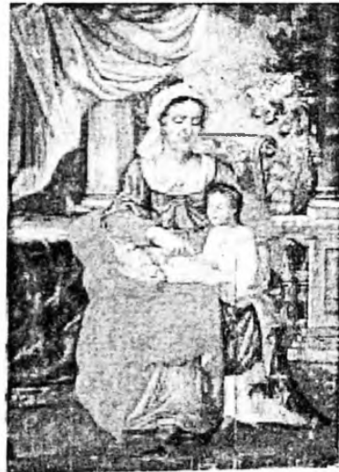
Св. Анна павчас Богородицю. XVIII ст. Полотно, темпера. 146x102 см.