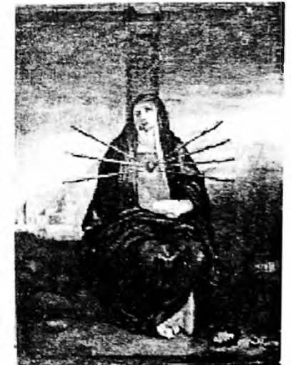
Сім печалей Богородиці. XIX ст. Полотно, олія. 71x54 см.