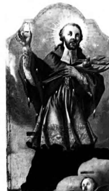
Св. Ян Непомук. XVIII ст. Полотно, олія. Реставрувала Гордіца Софія