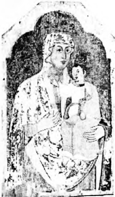
Богородиця Одигітрія. XVII ст. Дошка, темпера. 106x64 см.