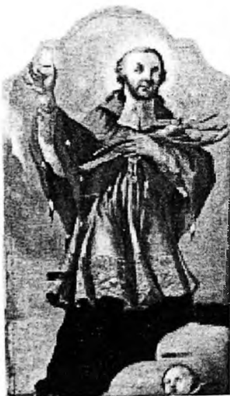
Св. Ян Непомук.

Поч. XVIII ст. Дошка, темпера. 87x68 см.