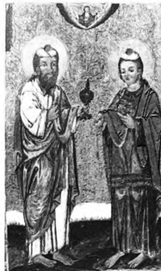
Святі Кузьма і Дем'ян. XVIII ст. Дошка, темпера. Реставрувала Площанська Мирося.