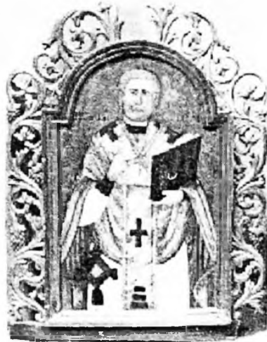
Св.Миколай. Поч.ХVIII ст. Дошка, темпера. 94x72 см.