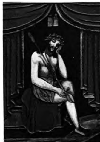
Христос у темниці. XIX ст. Полотно, олія. Реставрував Скоропадський Олег