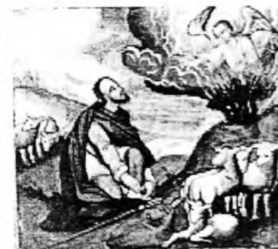
Іван Руткович. Неопалима Купина.