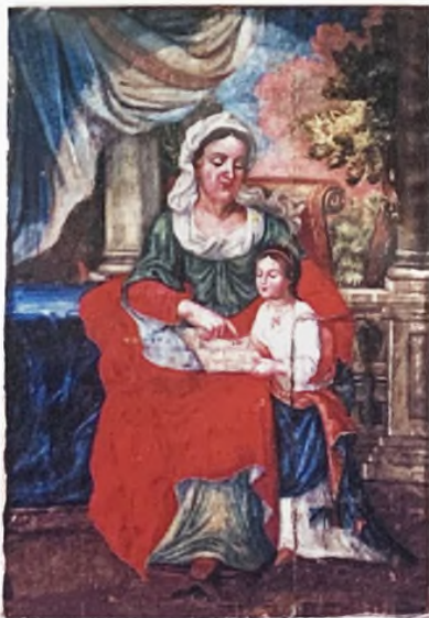
Св. Анна навчас Богородицю. XVIII ст. Полотно, темпера. Реставрував Вороняк Ю.