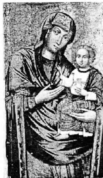
Іван Руткович. Богородиця Одигірія.

Поч. XX ст. Полотно, темпера. 195x190 см.