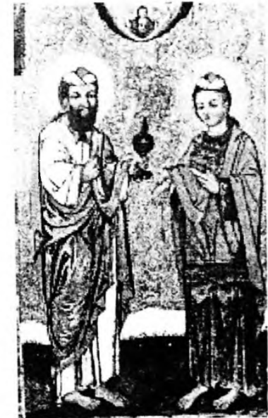
Святі Кузьма і Дем'ян. XVIII ст. Дошка, темпера. 92x60 см.