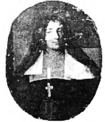
Г.Міле. Клементина Собеська-Стюарт. 1694р. Полотно, олія. 74x60см.