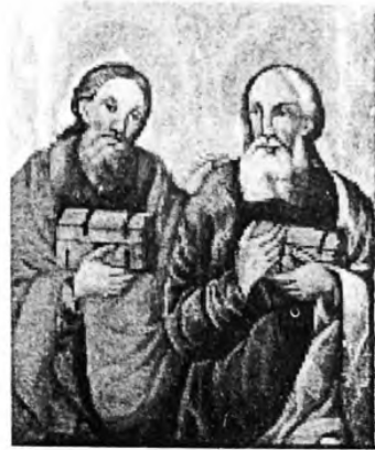
Святі Кузьма і Дем'ян. XVIII ст. Дошка, темпера. 79x59 см.