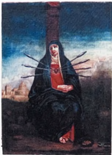
Сім печалей Богородиці. XIX ст. Полотно, олія. Реставрувала Целуйко О.